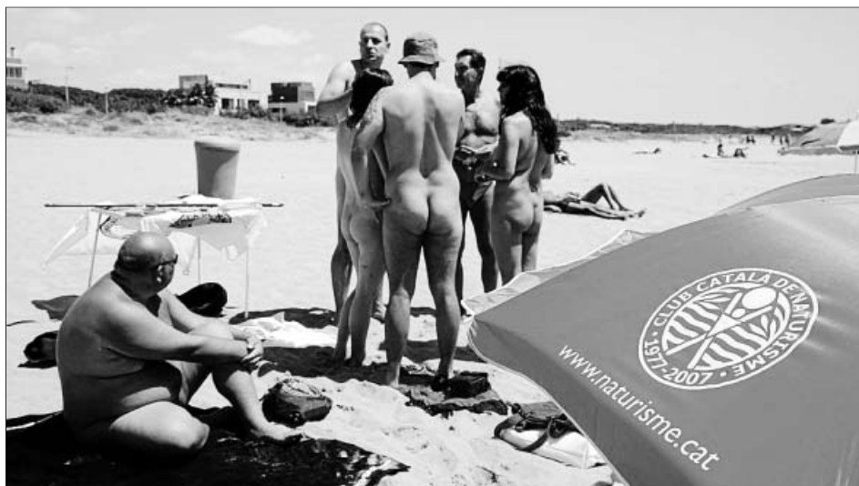
El Día sin bañador, en la playa de Gavà (Barcelona), el pasado 19 de julio.

En el otro lado está un colectivo que reclama playas familiares en las que se garantice «el respeto a los demás usuarios» y «el amparo de la