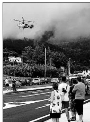
Un helicóptero arrojaba ayer agua sobre el incendio de Ávila.

Al cierre de esta edición, el fuego, aparentemente intencionado, contaba con tres