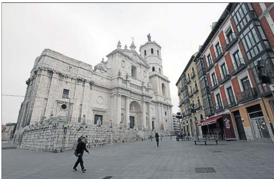
Fachada de la catedral de Valladolid en cuya torre derecha se colocará el ascensor.

La Junta implantará un impuesto para gravar la energía nuclear de la central de Garoña, en Burgos, que continuará al menos cinco años más. Se igualará así a la ecotasa que deberán pagar las empresas con embalses y parques eólicos